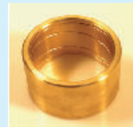
Messingemne med indvendig profil

aludesign specialbolte værktøjer beslag maskindele stålkonstruktioner møbeldele plastikfræste emner master & stolper rustfrie beholdere aksler designede metalemner ring og hør mere!