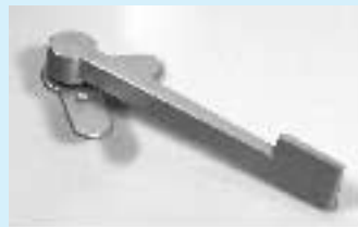
Sammensat CNC fræset emne i aluminium.