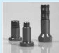
Bolte og andre små emner