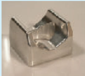
Færdig fræst alu emne