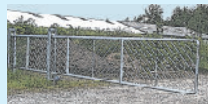
større konstruktioner som porte og master m.m.